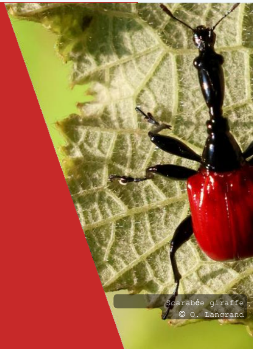
Scarabée giraffe