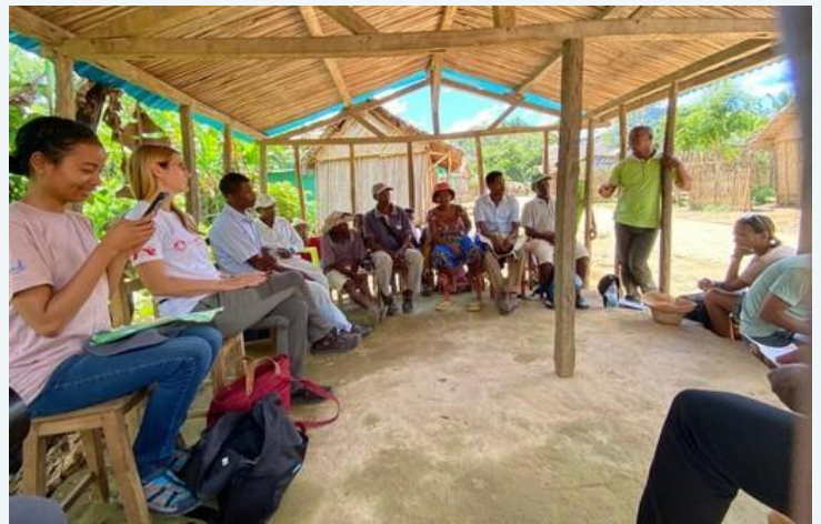
Réunion Communautaire avec Madagascar Fauna & Flora Gfroup près de la réserve de Betampona