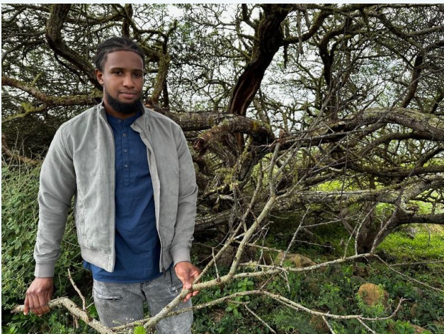
Acacia Nilotica, Rodrigues