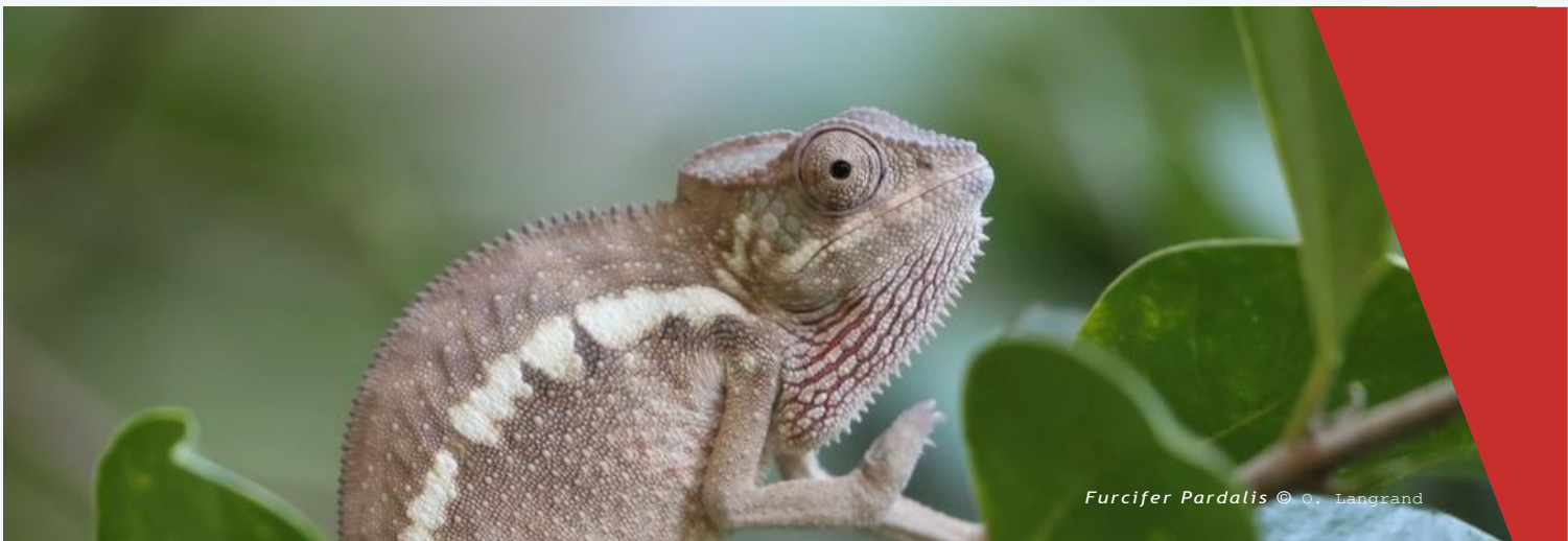
Furcifer Pardalis