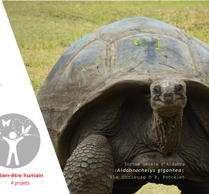
Tortue géante d'Aldabra ( Aldabrachelys gigantea ) Ile Curieuse