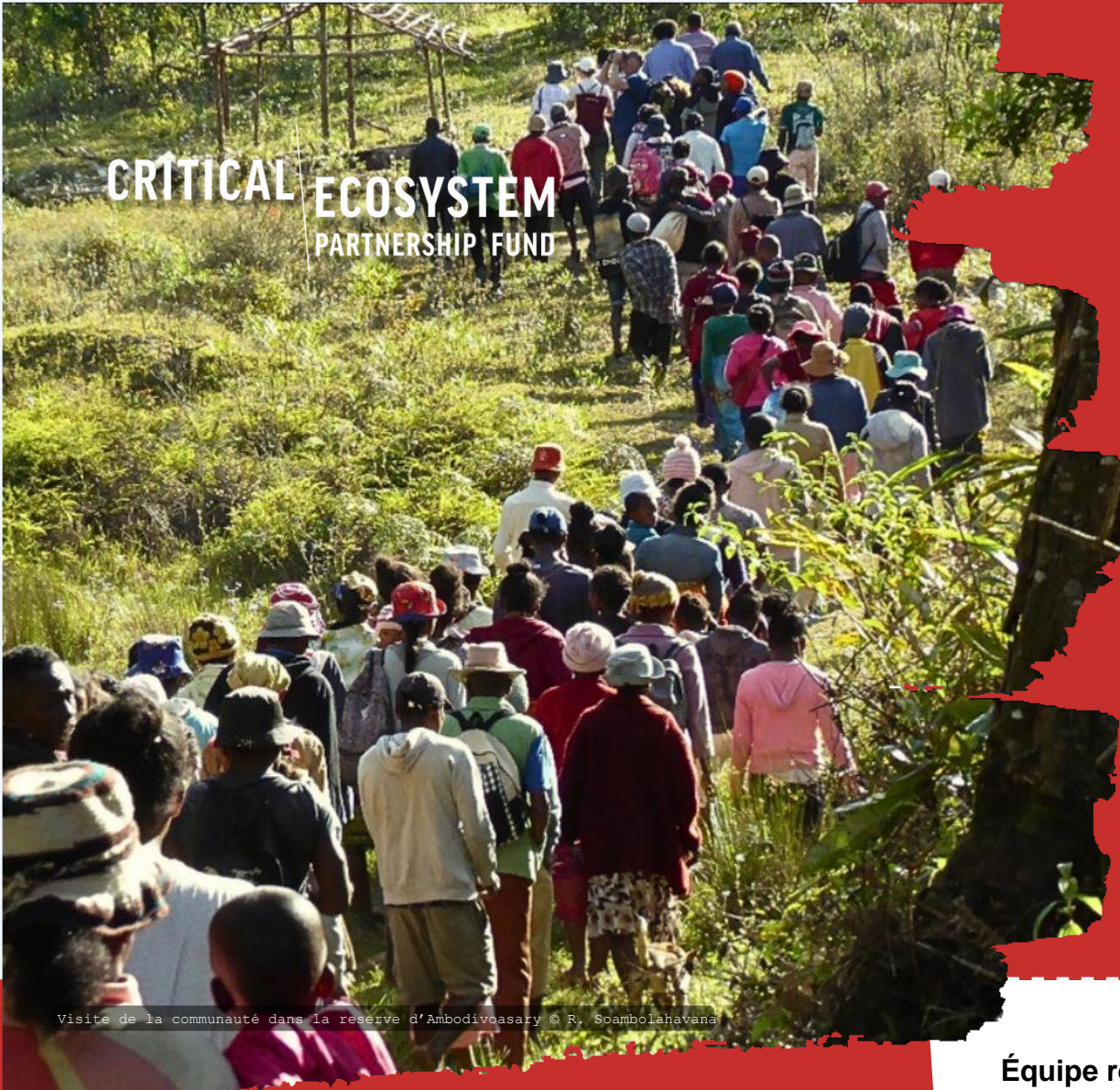
Visite de la communauté dans la réserve d'Ambodivoasary