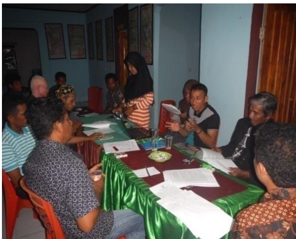
#Kegiatan :DiskusiTerfokusolehKelompok Inti

Sedangkan Output kedua: Desa Memiliki Daerah Perlindungan Laut (DPL) berdasar hasil kajian Ilmiah dan ditetapkan secara partisipatif melalui konsultasi dengan warga dan pemerintah desa. Output ini dianggap berhasil karena semua kegiatan, strategi, dan indikator pendukungnya terpenuhi. Ini dapat dicapai secara baik, karena prosesnya secara nyata telah melibatkan warga. Beberapa warga masyarakat dikategorikan sebagai kelompok inti yang diundang dan selalu dilibatkan dalam setiap diskusi-diskusi terfokus. Mereka berasal dari para tokoh-tokoh masyarakat. Kelompok inti ini dilibatkan untuk turut memberikan saran dan masukan dalam penyusunan rencana pengelolaan DPL dan keberadaannya secara suka rela. Karena kelomponya tidak mengikat, jumlah anggotanya kecil, tetapi terorganisir, terdiri dari perwakilan pemerintah Desa, Perguruan Tinggi, tokoh-tokoh masyarakat, pemuda dan nelayan sehingga keputusannya mewakili semua unsur di desa dan terlegitimasi di masyarakat. Hal inilah yang membuat tim Semank berhasil dalam menyusun rencana kerja DPL dan kegiatan lainnya dengan baik. Pelajaran pentingnya; pendampingan organisasi yang kecil/kelompok inti, dipilih dari semua unsur masyarakat di desa, diberikan tugas dan tanggungjawab, didampingi oleh staf proyek dengan metode pendampingan terstruktur, kelompoknya terorganisir, pengelolaannya baik, serta mendapat dukungan sosial dari masyarakat, maka kegiatan-kegiatan yang dikerjakan mempunyai tingkat keberhasilan yang tinggi.