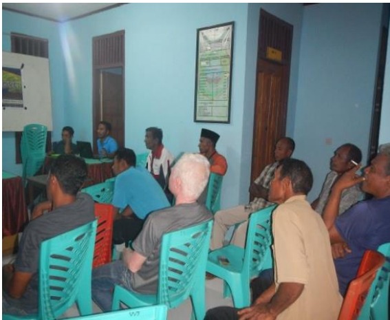
#Kegiatan; Rapat Pembentukan KP-DPL

Fasilitasi sebuah pertemuan formal yang dihadiri oleh perwakilan warga (petani, nelayan, pemuda, tokoh perempuan) dan aparat desa/kecamatan pada tanggal 09 februari 2018. Pertemuan ini dalam rangka Pembentukan Kelompok pengelolah DPL. Setelah melalui diskusi mendalam, maka di akhir pertemuan menghasilkn 21 orang warga desa Gotowasi yang di tetapkan menjadi kelompok pengelolah DPL. Dari 21 orang tersebut terdiri dari 20 orang laki-laki dan satu orang perempuan. Kegiatan pembentukan kelompok pengelolah DPL ini bertempat di Kantor desa Gotowasi. Sedangkan rapat-rapat kelompok DPL dilaksanakan di sekretariat KP DPL. Anggota kelompok ini berasal dari warga masyarakat desa Gotowasi sendiri yang menurut peserta rapat dan tim Semank mereka memiliki kecakapan dan aktif terlibat pada semua kegiatan program serta sebagian besar berprofesi sebagi nelayan. Selanjutnya kempok pengelolah DPL ini di dampingi dalam penguatan kapasitasnya, sebab kelompok pengelolah DPL ini yang akan melanjutkan kerja-kerja dalam pengelolaan dan pelestarian lingkungan khususnya di kawasan DPL yang sudah di tetapkan bersama. Keberadaan kelompok pengelolah DPL ini diharapkan dapat terus mendorong perubahan perilaku masyarakat setelah akhir proyek.