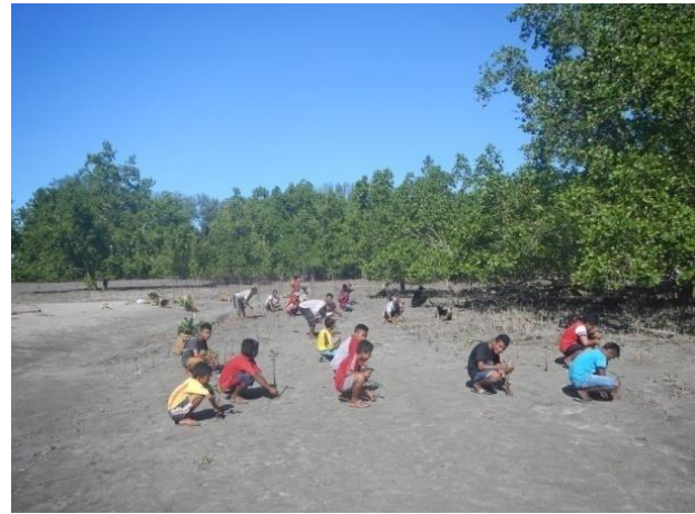
#Keterlibatanmasyarakatdansiswa SMP maupun SMA padakegiatanpenanaman

Indikator 2 dipenuhi melalui capaian perilaku warga desa Gotowasi yang tidak lagi menebang pohon mangrove. Karena sudah adanya kesadaran dari warga desa Gotowasi untuk melestarikan hutan mangrove, selain itu juga telah ada alternatif bagi warga desa Gotowasi dalam pengambilan kayu bakar dan atau untuk keperluan bangunan pada hutan yang saat ini sudah di lintasi jalan kabupaten. Kini aktifitas warga desa di hutan mangrove mengalami penurunan, hal ini disebabkan karena warga desa sudah memiliki pengetahuan tentang pentingnya melestarikan hutan mangrove. Data awal sebelum proyek CEPF dilaksanakan, kebiasaan warga desa Gotowasi dalam pemanfaatan sumber daya pesisir sangat tidak memperhatikan keberlangsungan ekosistem di wilayah pesisir desa Gotowasi. Kebiasaan warga desa Gotowasi dalam pemanfaatan sumberdaya seperti kerang, ikan dan biota lainya serta penebangan kayu mangrove terbilang cukup besar. Penebangan hutan mangrov hingga diperkirakan laju kerusakannya per tahun tahun bisa menembus 3 sampai dengan 4 hektar. Penebangan kayu mangrov ini umumnya dijadikan sebagai kayu bakar dan penebangan paling terbanyak biasanya menjelang bulan ramadan.