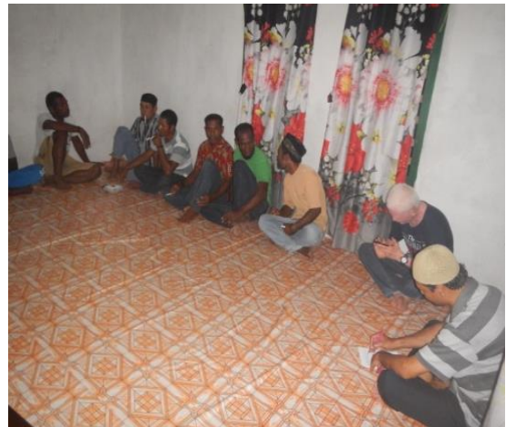
#Kegiatan; Reviuw Program Kerja Bersama KP-DPL