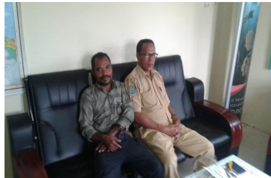
Ketua Kel. DPL bersama Kadis Pariwisata disela diskusi tentang pengemabngan kawadsan DPL