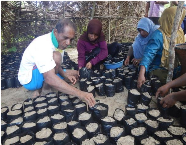
#Proses penataan bibit mangrove di kebun permaian

dalam kegiatan ini adalah seluruh anggota kelompok berjumlah 30 orang yang terdiri dari 18 orang laki-laki dan 12 orang perempuan. Kedua dilaksanakan pada tanggal 10 oktober 2017 dengan jumlah peserta 20 orang yang terdiri dari 13 orang perempuan dan 7 orang laki-laki. Sedangkan kegiatan ketiga dilaksanakan pada tanggal 2 november 2017 dengan jumlah peserta 40 orang yang terdiri dari 26 orang laki-laki dan 14 orang perempuan. Secara umum Seluruh anggota kelompok berpartisipasi dalam kegiatan pembuatan kebun pembibitan mulai dari pembersihan sampai dengan pembuatan pagar kebun hingga penyemaian bibit.