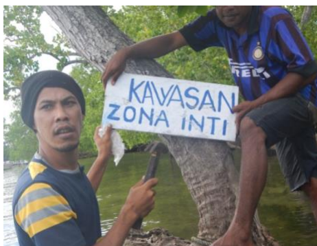
#Kegiatan; Pemasangan Batas Kawasan DPL dan Papan Informasi Tentang Larangan dan Model Pemanfaatan DPL. Serta monitoring kawasan DPL