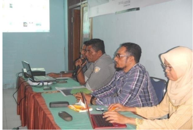
#Kegiatan; Kepala Desa Gotowasi mendampingi tim Sosialisasi Studi Ekologi