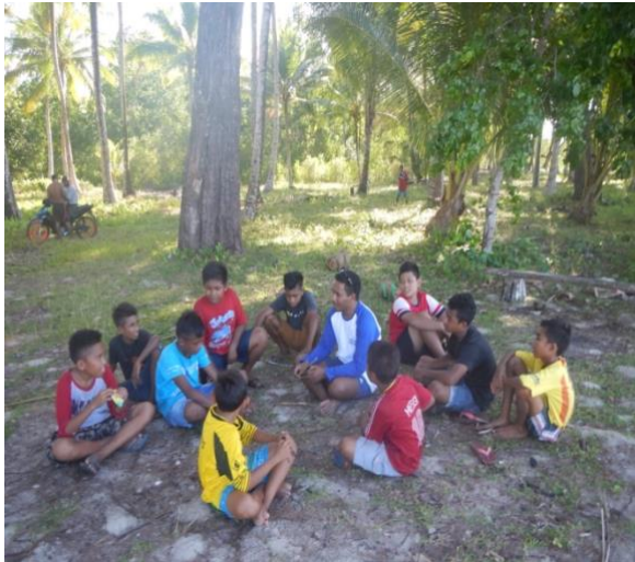
#Kegiatan; BersamaSiswa SD dan SMP