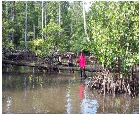
#Kegiatan; Warga memantau pertumbuhan anakan mangrove yang ditanam

Indikator 3 dipenuhi melalui capaian penyusunan buku profil ekosistem pesisir dan laut desa Gotowasi, buku ini di susun berdasarkan hasil studi ekologi dan kajian ilmiah yang melibatkan akdemisi di Universitas Khairun Ternate. Di dalam buku profil ekosistem pesisir dan laut ini telah memuat tentang potensi sumber daya dan keanekaragaman hayati yang hidup dan berasosiasi di ekosistem pesisir dan laut yang ada di desa Gotowasi. Hasil ini kemudian di sosialisasikan kepada warga desa dalam bentuk rapat umum serta FGD yang melibatkan perwakilan pemerintah daerah kabupaten Halmahera Timur, seperti Dinas Perikanan dan Dinas Kebudayaan dan Pariwisata. Para pihak yang hadir mendapatkan informasi tentang potensi sumber daya dan keanekaragaman hayati (biota) di daerahnya, yang diharapkan dapat menjadi dasar untuk menetapkan daerah perlindungan laut (DPL) dan model pengelolanya. Capaian (verifikasi) dari pendampingan pembentukan kelompok dan penyusunan dokumen rencana kerja kelompok pengelola DPL, yaitu: