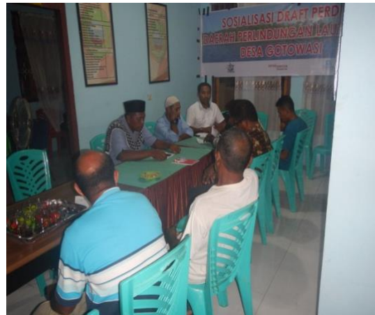
#Kegiatan; FGD dengan Pemerintah Desa, Toko Masyarakat dan Kelompok Pengelola DPL