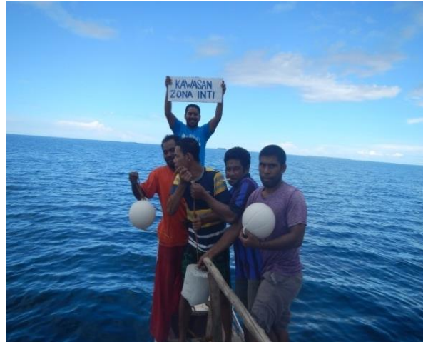
#Kegiatan; PemasanganPalbatasKawasan DPL

Sampai akhir program semua kegiatan atau strategi dilakukan sebagaimana yang dirancang. Semua kegiatan dan strategi dapat diterapkan, meskipun jadwal pelaksanaannya berbeda dengan kerangka waktu yang disusun sebelumnya.