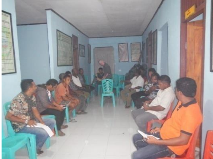
#Kegiatan; DiskusiTerfokusantaraKelompokPengelola DPLdanPemerintahDesa