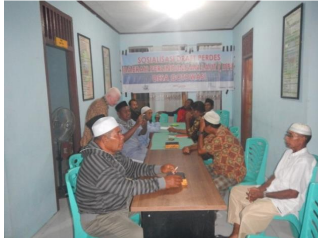
#kegiatan finalisasi; Sosialisasi Perdes kepada pemerintah desa dan tokoh masyarakat setelah ada pemantapan dari internal tim penyusun

Kegiatan pendampingan finalisasi peraturan desa ini mengalami hambatan, karena aktivitas keseharian tim penyusun draft perdes yang sulit disesuaikan dengan jadwal proyek. Akibatnya mempengaruhi jadwal kegiatan finalisasi penyusunan draft perdes sehingga mengalami pengunduran.