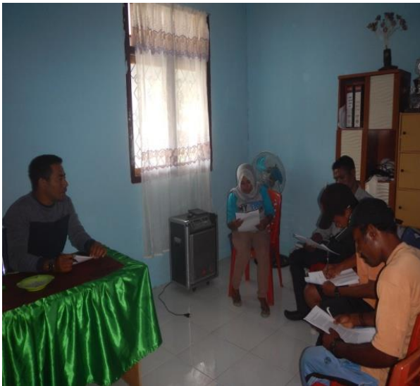
#Kegiatan; FGD Bersama Pengurus BUMDes Penyusunan Dokumen Rencana Kerja KP-DPL