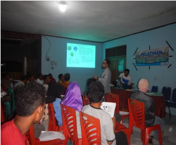
#Kegiatan; Suasana di forum Pelatihan