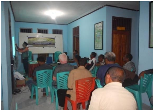
#Narasumber saat menyampaikan materi

Sebagai desa yang di kelilingi oleh hutan mangrove maka interaksi mereka dengan hutan mangrove sudah menjadi hal yang biasa terutama dalam pemanfaatannya. Kebiasaan masyarakat yang hanya memanfaatkan hutan mangrove tanpa berfikir untuk melstarikanya menyebabkan ekosistem mangrove mengalami penurunan. Atas kebiasaan itulah, maka masyarakat penting untuk di latih dan diajak diskusi dengan tema-tema yang lingkungan hidup. Untuk memenuhi pengetahuan dan kesadaran masyarakat maka Yayasan Semank melaksanakan kegiatan pelatihan pembibitan dan penanaman mangrove yang melibat warga desa Gotowasi.