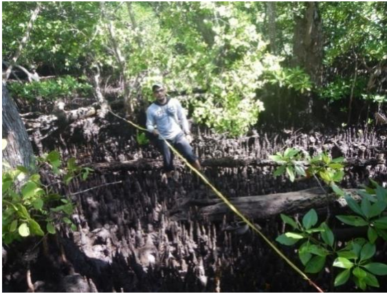
#Kegiatan; Studi Ekologi