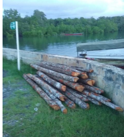
Keterangan Foto: Foto diambil sebelum proyek CEPF berlajalan. 08 Juni 2017