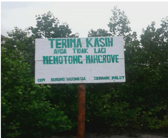
#Sederhana; Papan himbauan