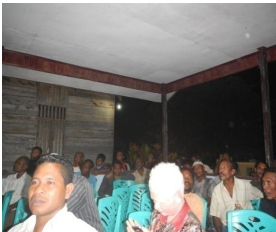
#Kegiatan; Sosialisasi Studi Ekologi dan Sekaligus Pembentukan Kelompok Pengelola DPL