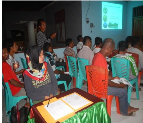
#Salah satu Peserta Bertanya

Kegiatan Pelatihan konservasi ekosistem pesisir dan laut bagi warga desa Gotowasi, dilaksanakan di kantor desa Gotowasi Pada tanggal 3 November 2017. Peserta yang hadir pada kegiatan sebagian besar adalah kelompok konservasi yang terbentuk berjumlah 45 orang dan masyarakat umum serta sejumlah siswa SMA. Dari jumlah peserta 45 orang tersebut terbagi atas 14 orang perempuan dan 31 orang laki-laki. Kegiatan pelatihan konservasi pesisir dan laut berlangsung selama satu hari.