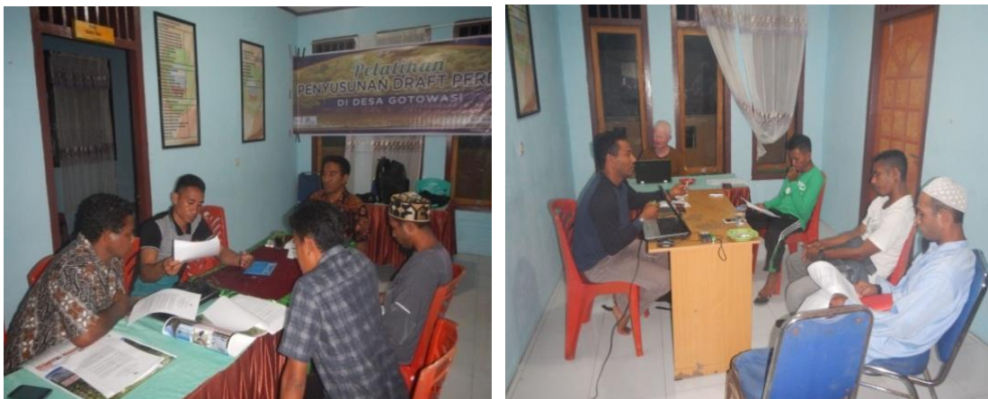
#Kegiatan; Fokus Diskusi Tim PenyusunPerdes

Pembentukan tim penyusun draft Perdes dilaksanakan di desa Gotowasi pada tanggal 2 Februari 2018 setelah kegiatan pelatihan penyusunan Perdes di gelar. Tanggal 3 Februari 2018 staf Semank mengundang tim penyusun draft Perdes untuk memulai pekerjaanya yaitu mendiskusikan materi yang akan dimuat dalam Perdes nanti, curah gagasanpun mengalir dalam diskusi siang itu. Hingga sore hari tim penyusun berhasil meramuh gagasan itu dalam bentuk tertulis dan selanjutnya menjadi draf Perdes.