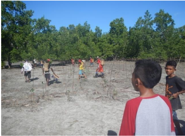
#Kegiatan Penanaman yang melibatkan siswa dan masyarakat

Dengan jumlah peserta 100 orang yang terdiri dari 27 orang perempuan dan 73 orang laki-laki. Selanjutnya dilakukan perawatan dan penggantian anakan yang mati dan tercabut akibat ombak dan arus oleh kelompok pembibitan.