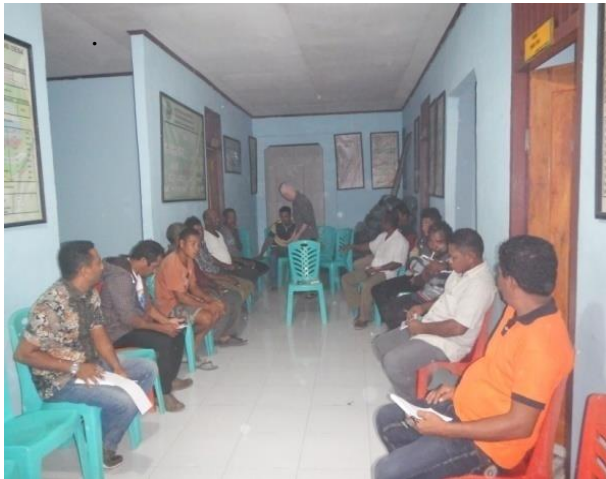
#Kegiatan; DiskusiTerfokusantaraKelompokPengelola DPL danPemerintahDesa

Output ketiga: Daerah Perlindungan Laut (DPL) dikelola oleh kelompok pengelola yang dipilih secara demokratis oleh warga Desa, dan memiliki rencana pengelolaan DPL yang terintegrasi dengan dokumen perencanaan pembangunan tingkat Pemerintah (Desa atau Dinas teknis). Capaian Output ini tidak berbeda jauh dengan Output kedua, yaitu dianggap berhasil karena semua kegiatan, strategi, dan indikator pendukungnya terpenuhi. Ini dapat dicapai secara baik, karena kelompok pengelola DPL sangat aktif dalam kegiatan yang dirancang. Pelajaran Pentingnya; Masyarakat harus diberikan ruang untuk turut ambil bagian atau berpartisipasi dalam pengelolaan Sumber Daya Pesisir secara penuh.