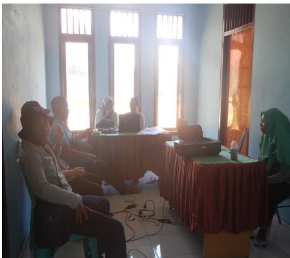
#Kegiatan; FGD Bersama Toko Perempuan

Dokumen ini telah mengalami beberapa kali perbaikan oleh Tim Semank dalam beberapa kali pertemuan diskusi terfokus. Dokumen ini diharapkan dapat menjadi pedoman bagi pemerintah dan masyarakat dalam melaksanakan pembangunan di desa, dengan tidak menutup kemungkinan adanya perubahan-perubahan strategi dan kegiatan yang dianggap perlu dan disesuaikan dengan kondisi lingkungan dan perkembangan masyarakat Desa Gotowasi.