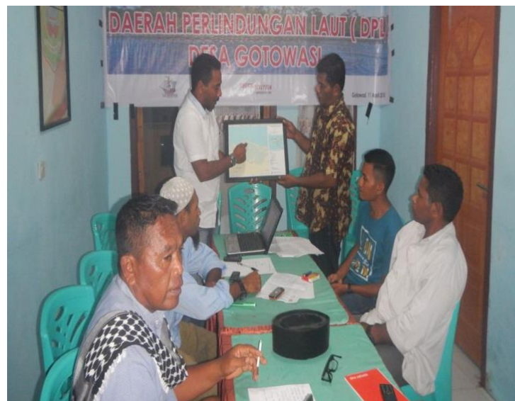
#Kegiatan; FGD Antar Pihak, Pemerintah Desa dan Toko Masyarakat sekaligus Penyerahan Peta Zonasi DPL

Proses pendampingan penyusunan dokumen yang memuat tentang rencana kerja kelompok Daerah Perlindungan Laut (DPL) Desa Gotowasi menyita waktu cukup panjang, dimulai dengan pengidentifikasian isu-isu atau perumusan masalah pengelolaan sumberdaya wilayah pesisir di desa.