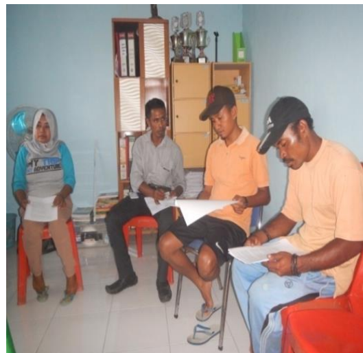
#Kegiatan; FGD Bersama BUMDes Gotowasi