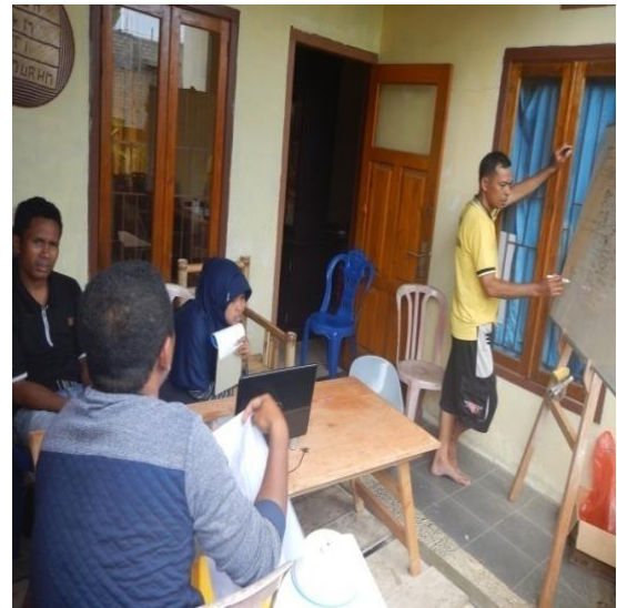
#Kegiatan; Reviuw Progres Lapangan Penyusunan DPL oleh Tim Semank

Indikator 5 Terpenuhi dengan adanya sinkronisasi program antara kelompok pengelola DPL dan RPJMDes desa Gotowasi. Telah termuat dalam RPJMDes desa Gotowasi bahwa kawasan pesisir Tapalo (kawasan/zona pemanfaatan DPL) akan di dorong di sektor wisata dan oleh karena itu BUMDes Gotowasi merupakan lembaga yang di berikan kewenangan oleh pemerintah desa untuk mengelolanya. Sebagai lembaga yang mendapat mandat, maka program kerja kelompok pengelola DPL di integrasikan dengan rencana kerja BUMDes.