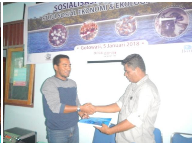
#Penyerahan; Buku Yang Memuat Profil Ekosistem Pesisir Desa Gotowasi

Indikator 4 Terpenuhi dengan terbentuknya satu kelompok pengelola DPL dan adanya dokumen program kerja DPL. Pembentukan kelompok pengelola DPL ini melalui suatu proses dan tahapan cukup panjang, mereka yang di kukuhkan hari ini menjadi anggota kelompok adalah warga masyarakat desa Gotowasi yang sebelumnya selalu terlibat pada setiap kegiatan yang dilakukan oleh Yayasan Semank. Selain terlibat dalam kegiatan pelatihan maupun diskusi informal, anggota kelompok DPL ini juga selalu terlibat pada kegiatan yang bersifat langsung dalam aksi nyata konservasi, seperti pembibitan, penanaman dan pemasangan tapal batas kawasan DPL. Dari proses pendampingan-pendampingan itulah maka melalui sebuah forum formal yang di hadiri oleh perwakilan warga (petani, nelayan, pemuda, tokoh perempuan) dan aparat desa telah memilih anggota kelompok pengelola DPL. Para anggota kelompok ini dipandang memiliki pengetahuan dan kepedulian terhadap pelestarian lingkungan dan dianggap akan bertanggungjawab terhadap keberlanjutan DPL. Setelah terbentuk pada tanggal 09 februari 2018 maka selanjutnya kelompok pengelola DPL di dampingi oleh staf Yayasan Semank melakukan konsolidasi kepada komponen masyarakat