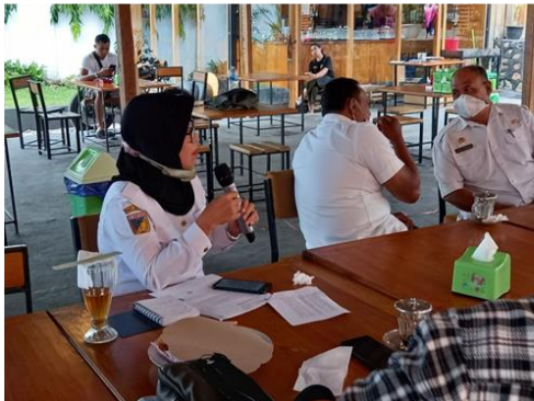
Keterangan Photo: Diseminasi Hasil Pencatatan Ikan di level Kabupaten yang melibatkan OPD dan Perguruan Tinggi, LSM dan Jurnalis