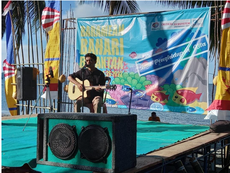
Keterangan Photo: Pembukaan Acara Baramean Bahari Balantak dengan menyanyikan lagu Putri Balantak yang dibawakan oleh pemuda Desa Pulo Dua

Adapun total partisipan yang tercatat sebanyak 118 orang yang terdiri dari 55 laki-laki dan 63 perempuan. Sementara yang tidak tercatat kuranglebih mencapai 500 orang yang menghadiri acara festival yang dilaksanakan selama 3 hari.