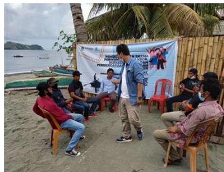
Dokumentasi kegiatan fokus grup terbatas di Pulau Dua melibatkan pemerintah Desa Luok, Ketua Kelompok Fajar Indah, Kelompok Perempuan, Nelayan dan pemuda.