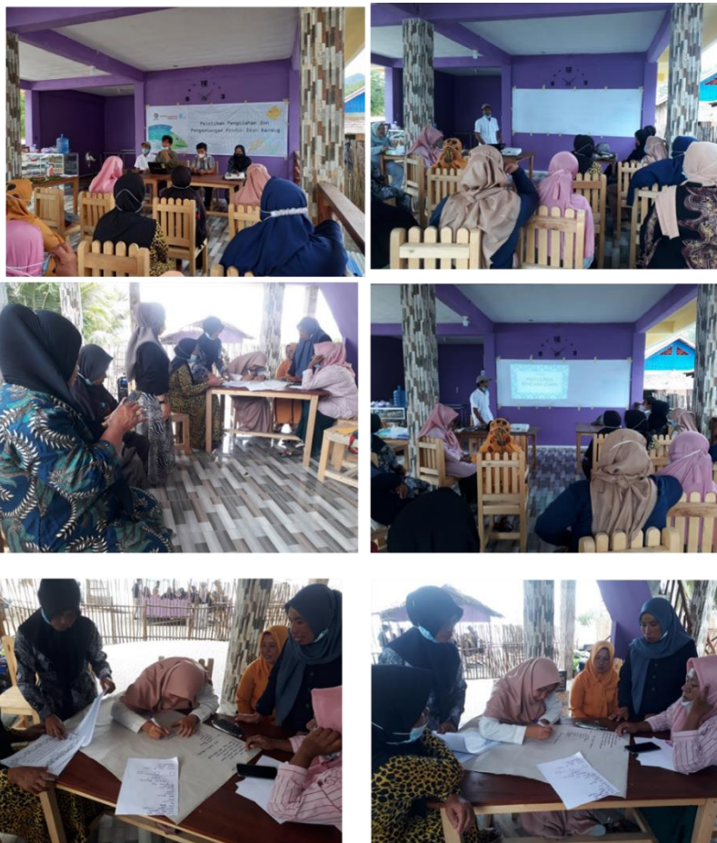
Keterangan Photo: Pelatihan pengelolaan usaha produk perikanan bagi kelompok perempuan berbasis komunitas

Kegiatan pelatihan dilakukan di masing-masing wilayah program yakni Talang Batu pada 7 hingga 8 Desember 2021 sedangkan di Desa Luok dilaksanakan pada 9 hingga 10 Desember 2021. Adapun jumlah partisipan dari Kelurahan Talang Batu; Laki-laki=4 Perempuan=16 Total=20 Desa Luok ; laki-laki=1 Perempuan=16 Total=17.