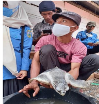
Keterangan Photo :Pelatihan penyelamatan spesies dan promosi pentingnya melindungi spesies yang terancam punah yang diikuti oleh kelompok DPL Tanjung Saro dan Fajar Indah