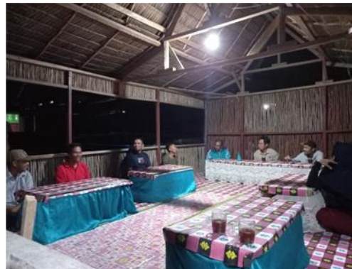
Dokumentasi kegiatan fokus grup terbatas di Kelurahan Talang Batu melibatkan pemerintah Kelurahan Talang Batu, Ketua Kelompok Tanjung Saro, Kelompok Perempuan, Nelayan dan pemuda.