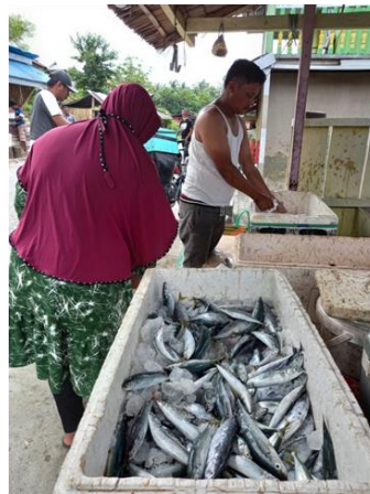
Keterangan Photo Proses pembongkaran dan transaksi ikan di Talang Batu