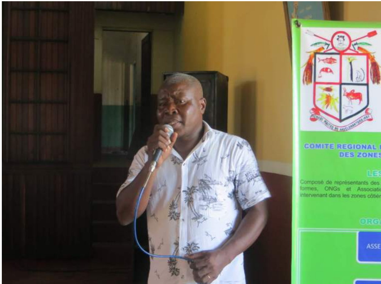
Vidéo sur l'impacts du slash and burn: https://videopress.com/v/XdH7PHHk