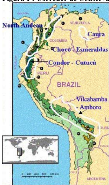
Figura 1 : Corredor de Conservación Vilcabamba - Amboró

Actualmente, se han consolidado, mediante disposiciones legales de carácter nacional, 16 áreas protegidas en el CCVA, 9 en el Perú y 7 en Bolivia (Cuadro 2). Además, en el Perú se estableció la Concesión de Conservación Los Amigos, de 1.376 km 2 de extensión, que es administrada por una organización privada y en Bolivia se creó el Parque Departamental de Altamachi, con una superficie de aproximadamente 5.600 km 2 , que es administrado por la Prefectura del Departamento de Cochabamba; se prevé que sea elevado a la categoría de parque nacional y área natural de manejo integrado. Ambas áreas contribuyen