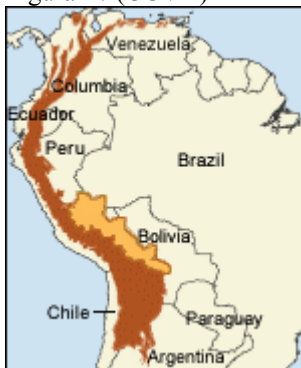
Figura 1 / (CCVA)

Ubicado en el hotspot Andes Tropicales, entre la región de la montaña de Vilcabamba en el Perú y el Parque Nacional - Área Natural de Manejo Integrado Amboró cerca de la ciudad de Santa Cruz de la Sierra en Bolivia. El CCVA abarca a más de 300.000 km 2 en una franja a lo largo de los flancos nororientales de los Andes e incluye 16 áreas protegidas (9 en Perú y 7 en Bolivia).