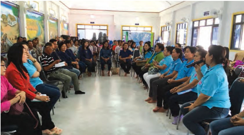
| การแลกเปลี่ยนเรียนรู้กันของแม่หญิงพะเยาและชาวบ้านบุญเรือง |

ด้วยการเห็นความสำคัญของบทบาทผู้หญิงต่อการอนุรักษ์จึงได้มีการดำเนินโครงการเพื่อส่งเสริมบทบาทแม่หญิงในการจัดการทรัพยากรในลุ่มน้ำอิงให้เพิ่มมากขึ้น โดยการปรึกษาหารือและดำเนินงานร่วมกันของสถาบันชุมชนลุ่มน้ำโขงและเครือข่ายแม่หญิงพะเยา มีการเดินทางไปแลกเปลี่ยนและเรียนรู้กับแม่หญิงลุ่มน้ำอิงในจังหวัดเชียงราย ทั้งที่ตำบลสันมะค่า บ้านบุญเรือง และเชียงของ ทำให้เกิดการประสานความสัมพันธ์และร่วมมือกันเป็นเครือข่ายพร้อมตั้ง “เครือข่ายแม่หญิงลุ่มน้ำอิง” ขึ้นในปี 2559 ซึ่งได้ทำกิจกรรมหลายอย่าง เช่น การประชุม อบรมพัฒนาศักยภาพ การจัดสัมมนา ศึกษาดูงาน งานวิจัยเชิงปฏิบัติการอย่างมีส่วนร่วม และกิจกรรมอนุรักษ์ในท้องถิ่น นอกจากนี้แล้วเครือข่ายฯ ยังมีแผนที่จะทำงานร่วมกันอย่างต่อเนื่อง เช่น การสร้างพื้นที่ตัวอย่างด้านการอนุรักษ์ที่ผู้หญิงเข้าไปมีส่วนร่วม เผยแพร่ความสำคัญของบทบาทผู้หญิง เป็นต้น