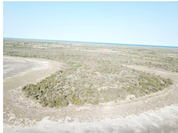
Vu aérienne de la zone de relâché choisie

9. Synthèse d'activités antérieures de mobilisation des parties prenantes: Si le bénéficiaire a déjà entrepris des activités, notamment en matière de communication des informations et/ou de consultation publique, fournissez les détails suivants: