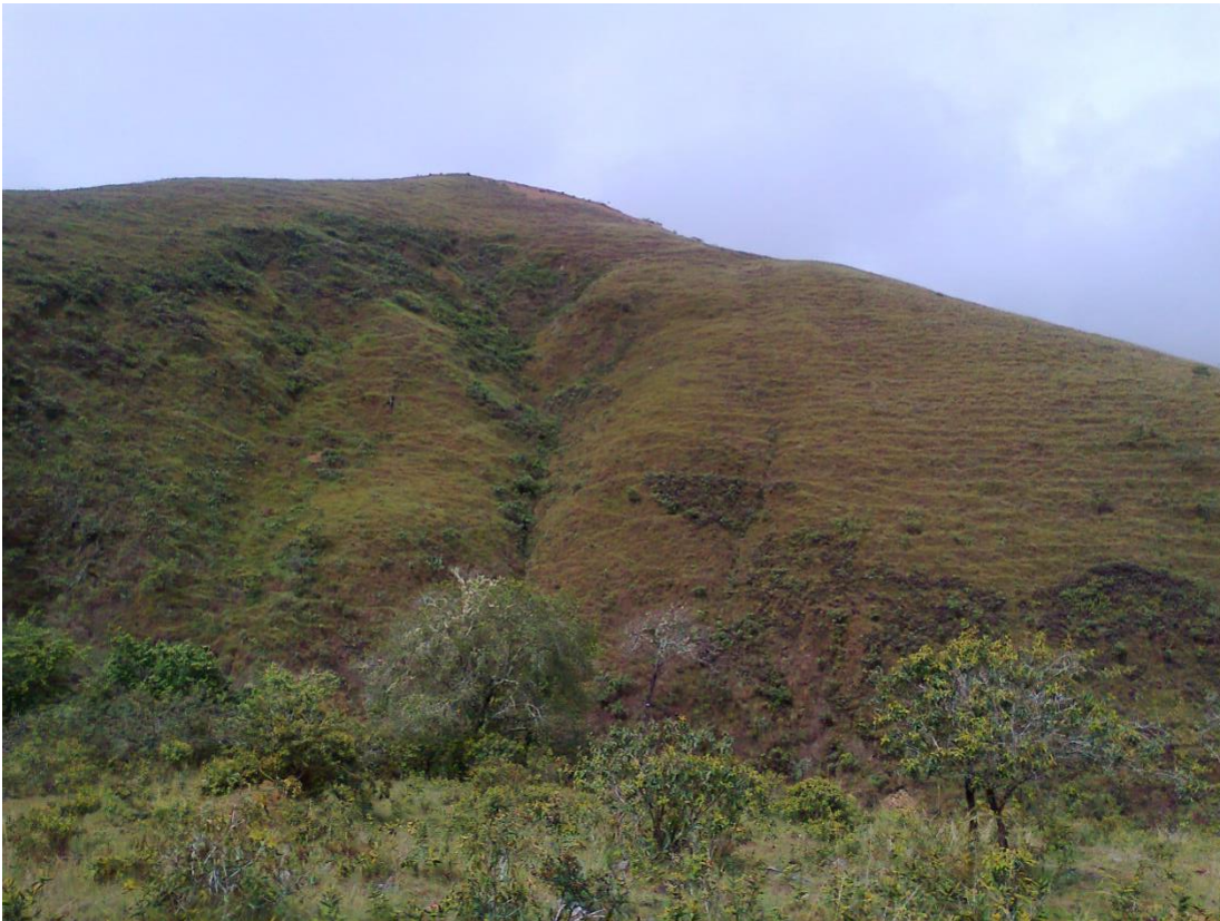
Figura 1: Serranía del Paramarani. Sabanas antropogénicas y relictos de bosque.

La vegetación de Apolo y del APM Serranía del Paramarani, de acuerdo al trabajo de Navarro (2007), corresponde a sabanas arboladas secundarias de los yungas pluvioestacionales, y a sabanas antropogénicas subandinas o montañosas, surcadas por relictos de bosques adyacentes a las corrientes de agua. La vegetación natural de las sabanas antropogénicas era boscosa, y estaba diferenciada según cierto gradiente de altitud y humedad. En la actualidad no se diferencia entre las pampas con clima estacional de los de clima pluvial, ni entre diferentes altitudes, porque el factor la degradación de la vegetación influye más sobre el aspecto de la vegetación que el factor climático. Se incluyen los lugares más altos, que deberían llamarse “Yungas montanos pluviales”. 3