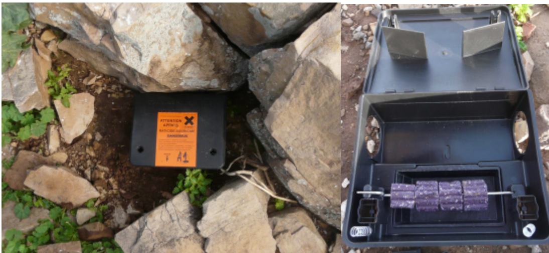
Figure 2: Boîtes anti-réinfestation installées sur Zembretta, remplies de blocs toxiques à base de brodifacoum. (Blocs de marque Facorat à base de Brodifacoum).