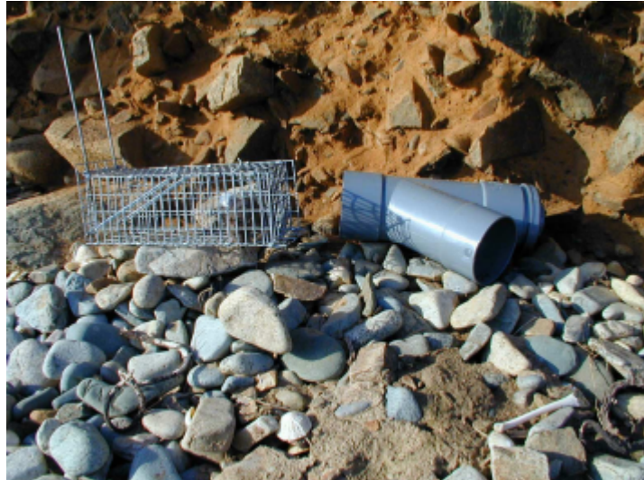
Figure 1: Station de piégeage composée d'une ratière et d'un tube PVC en Y.

l'aide de ratières « Manufrance » b. une lutte chimique à l'aide de grain d'avoine enrobé de bromadiolone dosé à 50 ppm c. la mise en place du dispositif anti-réinfestation d. un contrôle après dératisation pendant 1 an.