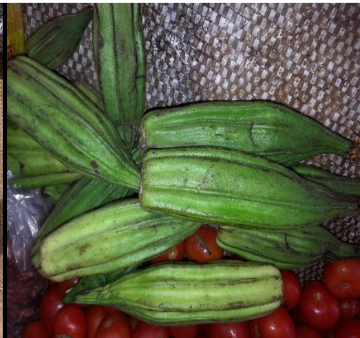
Alguno de los productos agrícolas.