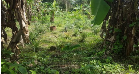
Fincas con algunos de los productos más demandados.