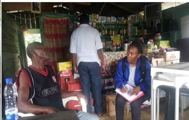
Entrevista con algunos pobladores de los poblados colindantes al parque Nacional de Pico Basile.