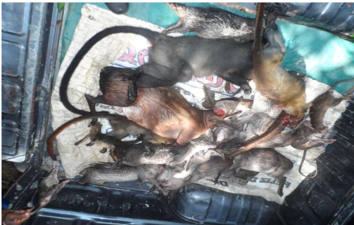
Especies faunísticas más sobresalientes.