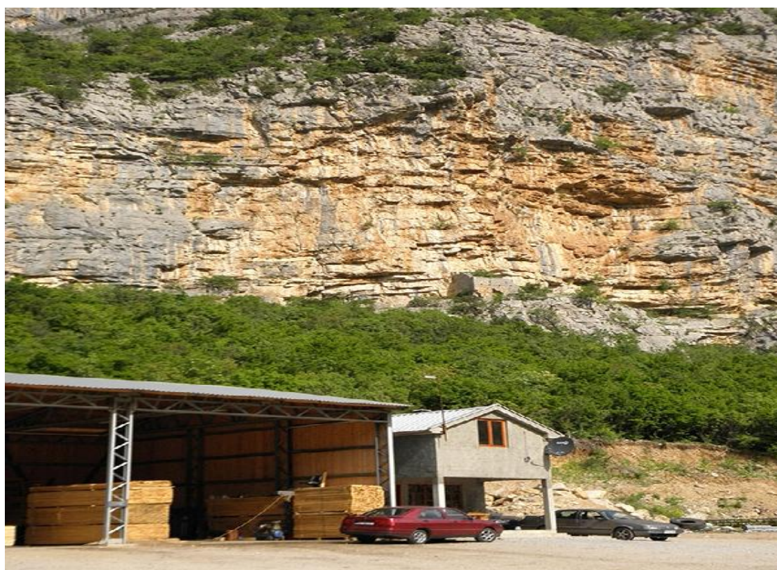
Slika 2 : Stijena predviđena za opremanje sa penjačkim stazama i obližnji parking