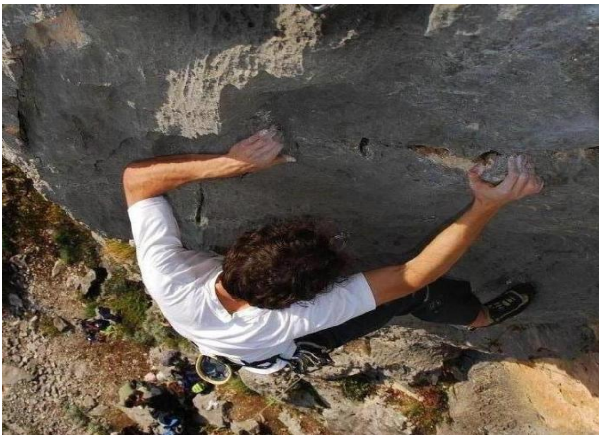
Slika 4 : Slobodno penjanje, lokacija Smokovac.