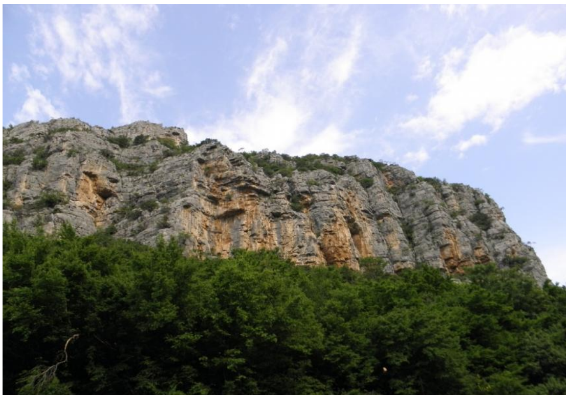
Slika 1 : Stijena predviđena za opremanje sa penjačkim stazama