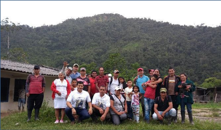
Acuerdos para la ampliación de la RFP Serranía del Pinche.