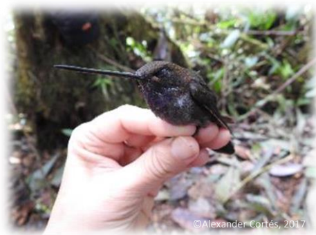
Inca pardo ( Coeligena wilsoni ). Casi endémica