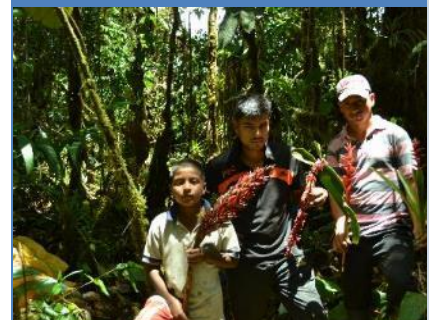
Jóvenes acompañantes de la colecta de plantas en bosque de niebla del corregimiento Santa Clara

La situación anterior, no impidió que la comunidad de la vereda Santa Clara mantuviera los acuerdos locales, defendiendo su biodiversidad de los cazadores, los taladores, los mineros y demás procesos de intervención antrópica, lo que implicó, en ocasiones, que los líderes locales arriesgaran su propia vida.