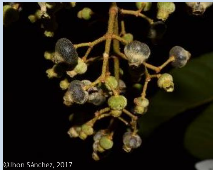
Glossoloma sp. nov. (GESNERIACEAE)