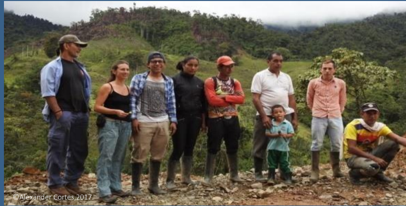
Biólogos e integrantes locales de la expedición ecológica en Santa Clara