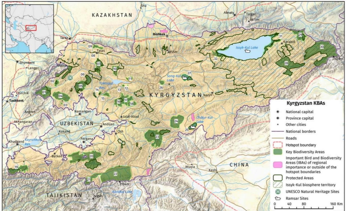
Figure 4.4. Map of KBAs in the Kyrgyzstan part of the Mountains of Central Asia Hotspot

В приоритете будут проекты не повторяющие и не конкурирующие с существующими проектами по отдельным видам. Мы поощряем проекты которые фокусируются на сохранении более крупных экосистем, и учитывают весь КБР, коридор и прилегающие территории. В идеале проектные предложения (заявки) должны использовать хорошо доказанные методы, и отталкиваться от положительного предыдущего опыта.